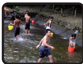
↑ 池の中の鮎を 瞬く間に捕まえる ↓