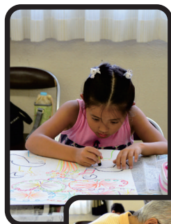
← 楽しく、熱心に 参加者 ポスターを描く ↓