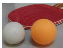
ラケットの表面とラージボール (写真右)

ラージボールは硬式と比べて、打球に回転がかかりにくく、スピードも抑えられるため初心者でも楽しむことができます。卓球をあまり経験されてない方も基本から学ぶことでかなり上達が可能です。