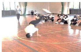
スポーツフェアでの ブレイクダンス体験