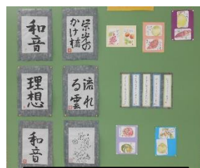
子どもたちの作品

なお、とよはしほっとプラザには、ほっとプラザ中央（前田南町）、ほっとプラザ東（大岩町）、ほっとプラザ西（牟呂町）の3か所あります。