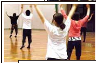
昨年の青年講座の様子