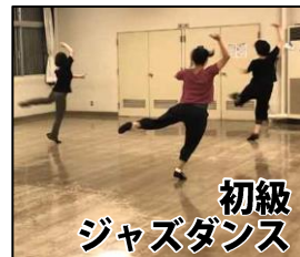
初級 ジャズダンス