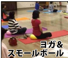
ヨガ& スモールボール