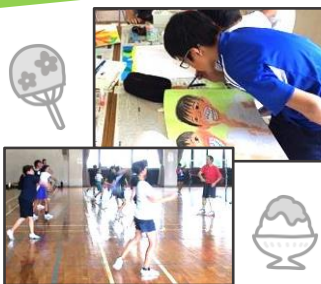
昨年の夏の講座の様子

梅雨明けが待ち遠しい今日この頃、子どもたちは夏休みを指折り数えて待っていることでしょう。ただ、今年の夏休みは、新型コロナウイルスの影響で長い休校があったため、8月1日から8月16日までの短縮日程となります。青少年センターでは、7～8月にスポーツ、音楽、科学、美術など小学生向けのいろいろな教室や講座を用意しています。今回は夏休みが短縮されても参加できるように、土・日に計画しました。積極的に挑戦し、豊かな体験をたくさんしてください。