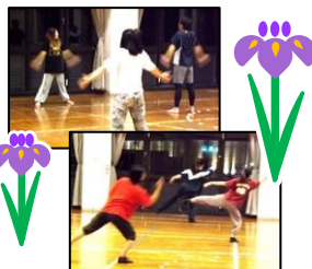
昨年のヒップホップ、ジャズダンスの様子