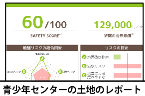
青少年センターの土地のレポート

地震による揺れやすさ、浸水リスクなどの項目のスコアと、合計スコアをわかりやすく点数化して表示。スマートフォンにも対応。