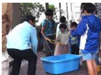
巨大シャボン玉の実験