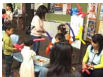
バルーンアート作り体験