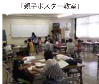
「親子ポスター教室」

7月25日より、ジュニアチャレンジ講座「バドミントン」を開講しました。この講座は、夏休み期間中にバドミントンを通してチャレンジ精神を育みながら、体力増進とスポーツ振興を図ることを目的としており、毎年多くの子どもたちが参加しています。最初はラケットの正しい握り方や素振りなど基礎的なことから始まり、サーブの打ち方や、遠くへ飛ばすテクニクなど受講生は真剣になっ