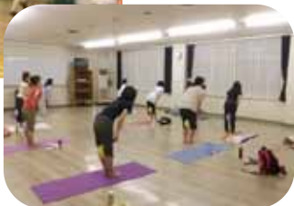
※写真は昨年実施時のものです。

青少年センターでは多くの主催事業を開催しています 参加者募集！！四季の行事教室「七夕のつどい」