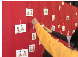
作品を赤い台紙につけて、飾りました