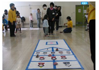
ひな飾り、うまくゲットできたかな！