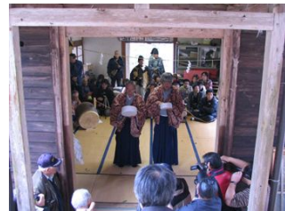
「鳥追い」は紙の太鼓で鳥を追い払います。