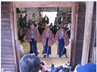
「萬歳楽」です。室内で舞われます。

設楽町東部の平山地区に古くから伝わる黒倉田楽は、毎年2月の第3日曜日に黒倉観音堂の祭礼として行われています。本年度の鑑賞・体験バスツアーは昨年に引き続きバス2台で催行し、33組77名の方が参加しました。途中奥三河郷土館とJA愛知東「こんにやく村」に立ち寄り、奥三河の歴史と特産品にも触れる旅となりました。