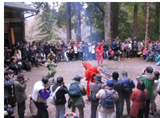
まつりのクライマックス「三鬼の舞」です