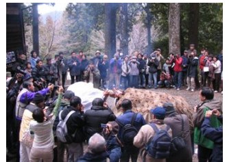
最後を飾る「獅子と駒」の掛け合いです