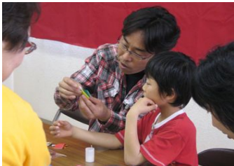
今年は折り紙と千代紙で人形を作りました

本年度の「ひなまつりのつどい」には、9組31人のみなさんが参加しました。はじめに千代紙でお内裏様とおひな様を作りました。その後ひなまつりにちなんだゲームや歌、パネルシアター等を年少からお年寄りまでの幅広い年齢層の参加者が楽しみました。