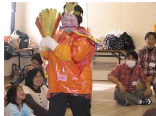
風変わりな人間びなも飛び入りで参加？